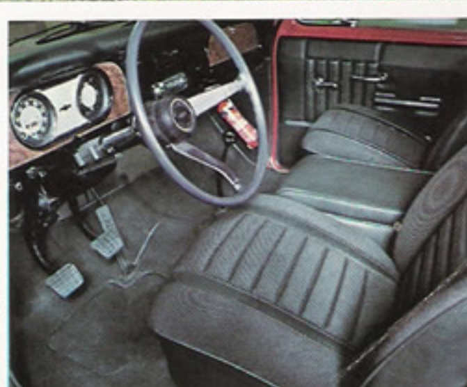
O interior do novo Chevy SL.

A General Motors é a única que oferece a mais completa linha de pick-ups do país. Para os que precisam de muita economia, em diferentes tipos de estrada, dando duro em trabalhos puxados, o novo Chevy 4, com o experiente motor de 4 cilindros. No Chevy 4, a economia faz a força. Para os que exigem mais do que um utilitário, combinando o trabalho do campo com a vida social da cidade, o novo Chevy SL, com motor de 4 e 6 cilindros, muito conforto, beleza, raça e esportividade. No Chevy SL, luxo deixou de