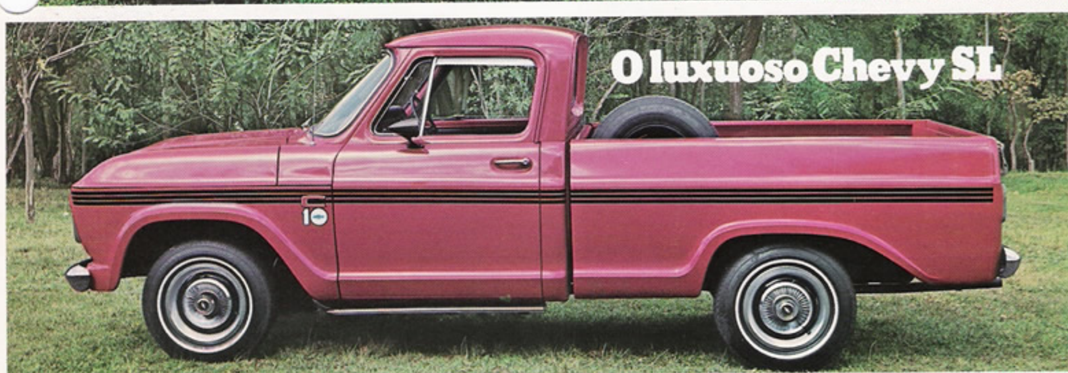
O luxuoso Chevy SL