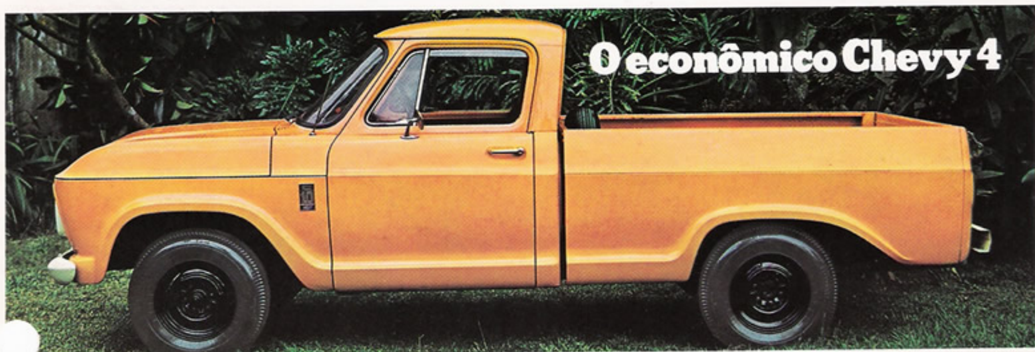
O econômico Chevy 4